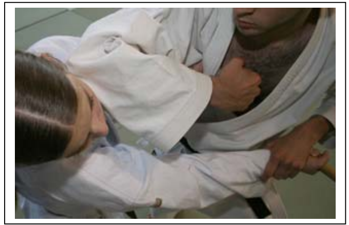
atemi circulaire du coude D visage 2