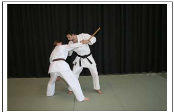
...pour dégraffer la saisie de revers 4