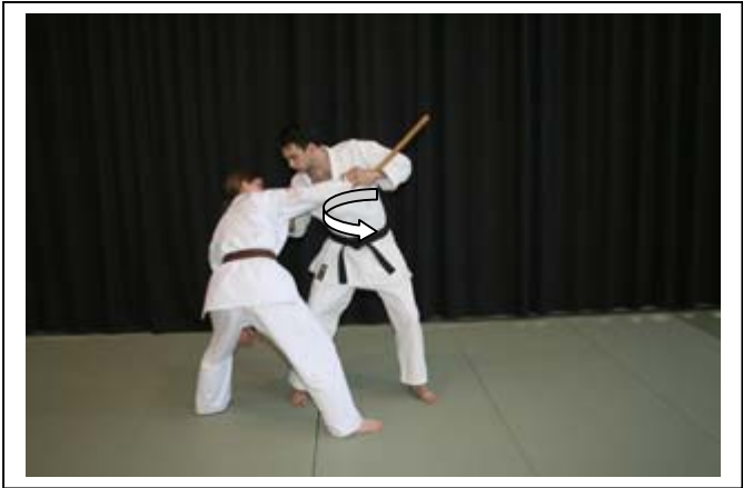
...pour dégrafer la saisie de revers, saisie de la main armée 4