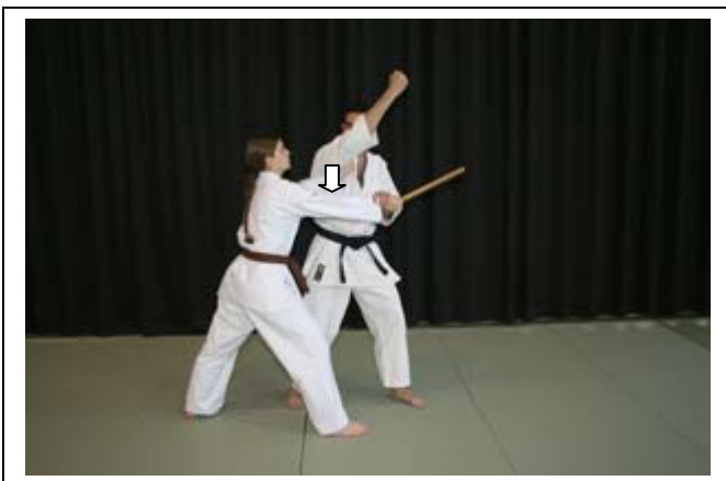
Armer le coude D et atemi vertical du coude... 3