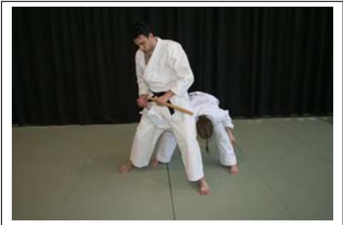
Désarmement en bras de levier 7