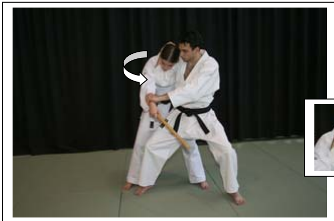
Saisie de la tête par enroulement du cou 5