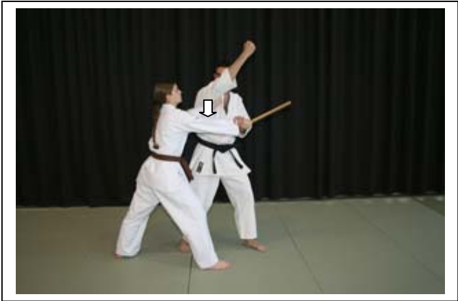
Armer le coude D et atemi vertical du coude... 3