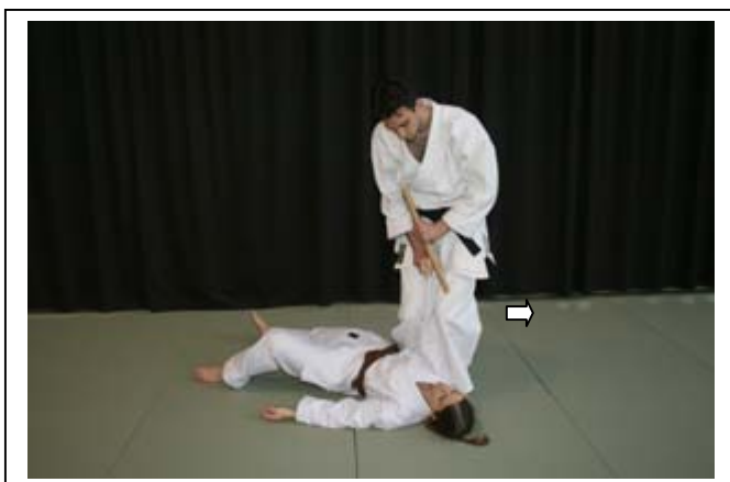
Saisie de la matraque et recul de la jambe G... 9