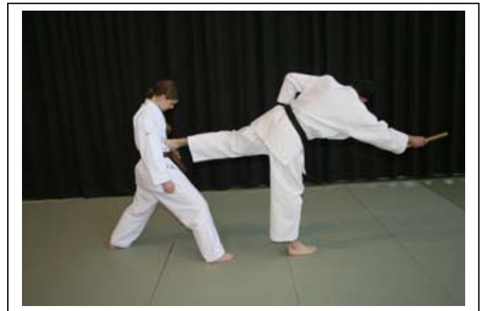
ATEMI PAR COUP DE PIED ARRIERE 8