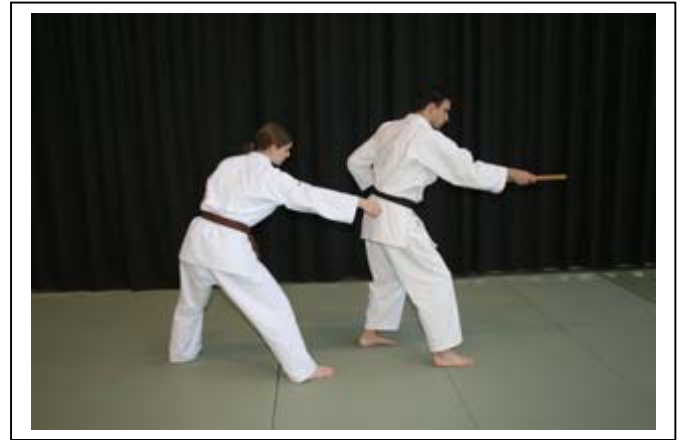
Déplacement vers l'avant avec jambe D 6