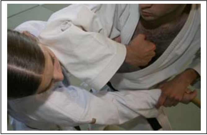
atemi circulaire du coude D visage 2