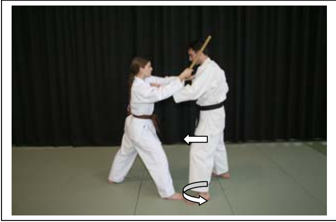
MATRAQUE : SAISIE D'UN REVERS ATTAQUE HAUTE EN BIAIS