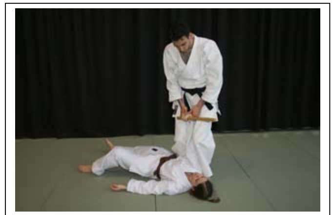
Désarmement en bras de levier sur le poignet 8