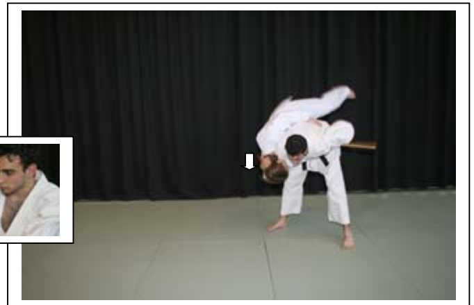
PROJECTION PAR LA TETE 6