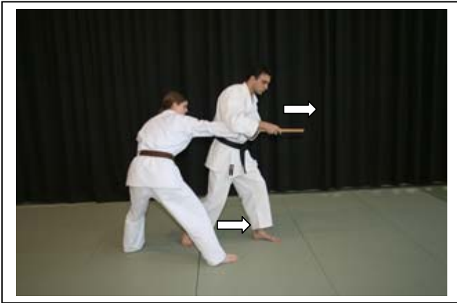
Désarmement dans le mouvement, en saisissant la matraque 5