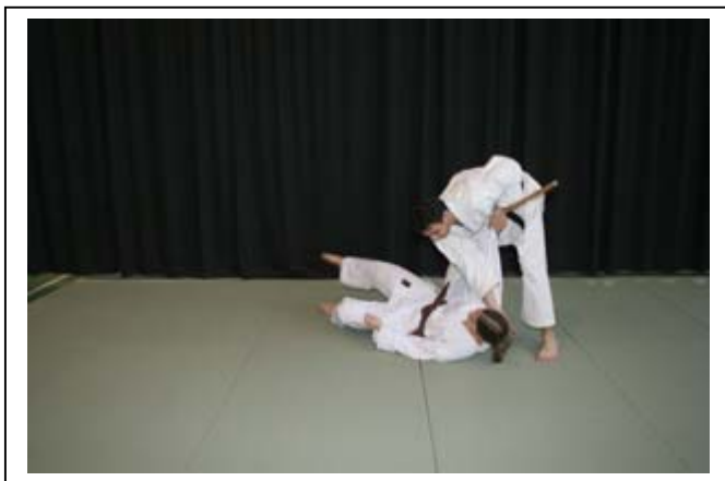
Contrôle de la chute (sécurité des vertèbres cervicales) 7