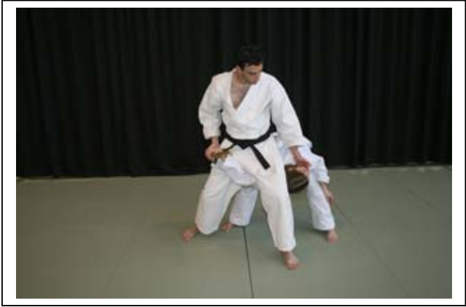
...Blocage du bras et saisie du menton en CLE DE COU 6