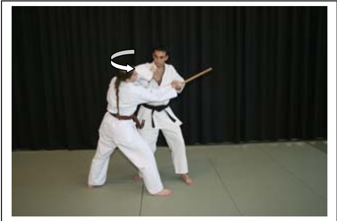
ESQ INT AV à 45°, brossage du bras armé, saisie du poignet 1