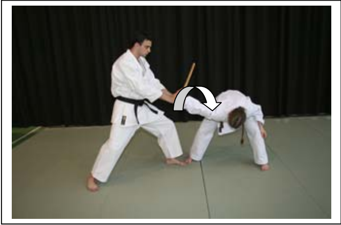
Rotation du tronc, clé de poignet, passer la jambe D... 5