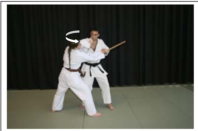
ESQ INT AV à 45°, brossage du bras armé, saisie du poignet 1