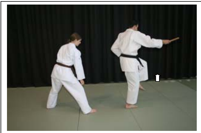
Armer la jambe G 7