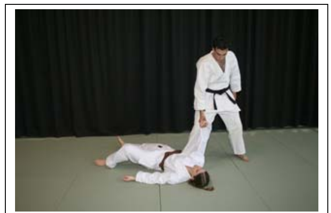
...et remise en garde 10