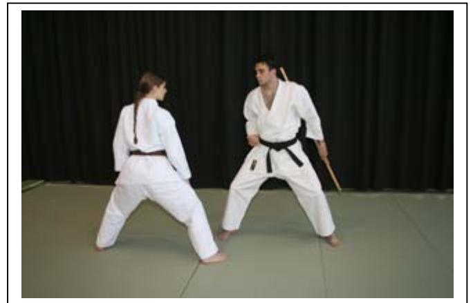
...ramener le bâton derrière le bras 6