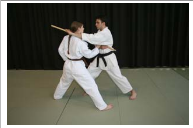
Maintenir le contact dans l'aisselle, saisir le bâton... 5