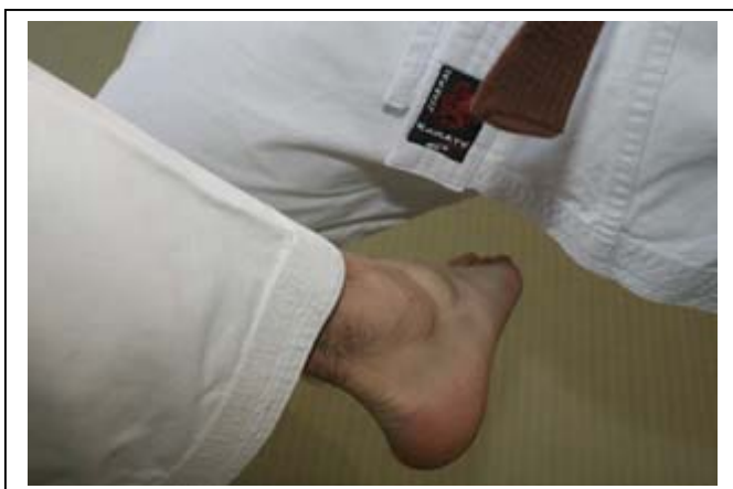
...cuisse interne ou genou 9