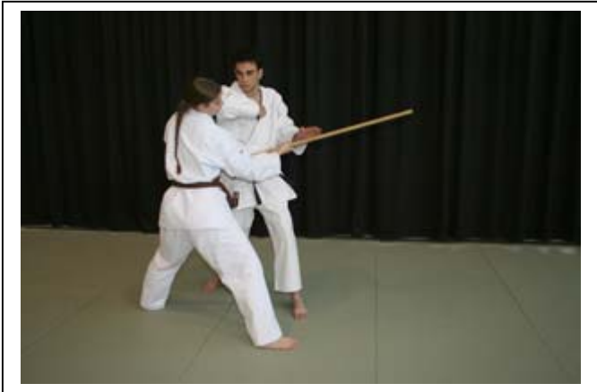
ESQ AV INT à 45°, atemi circulaire du coude D 1