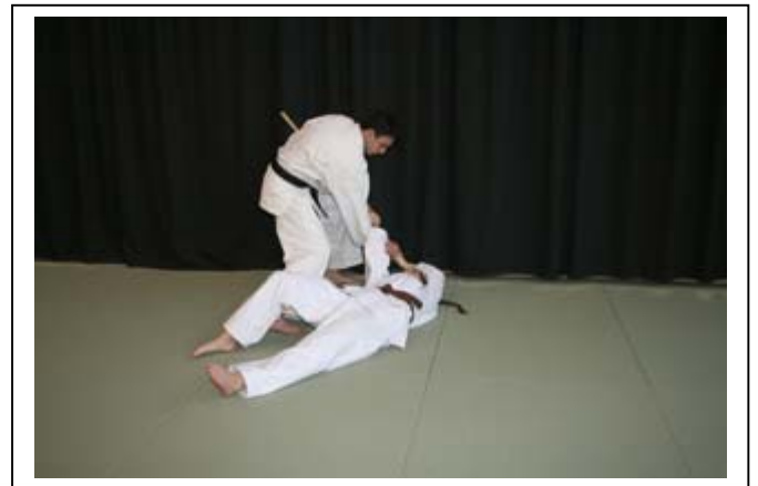
Contrôle au sol avec la pointe du bâton 8