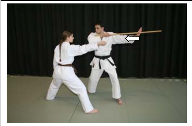
Dégager le bâton vers l'ARR 4