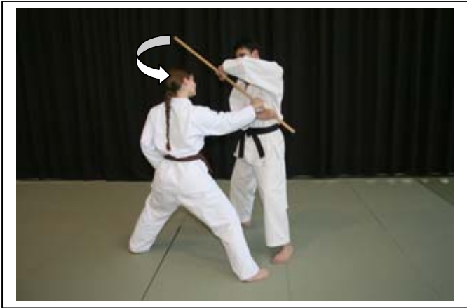
Amener le bâton sur la carotide G d'UKE 4