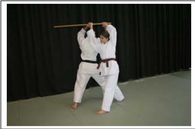
... En maintenant les 2 mains d'UKE bloquées 5