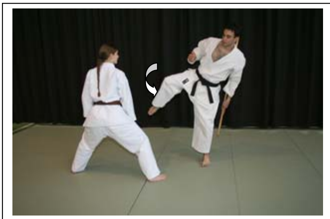
Armer la jambe D 7