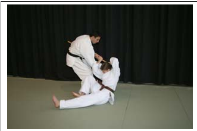
...CHUTE ARRIERE SANS LES MAINS 7