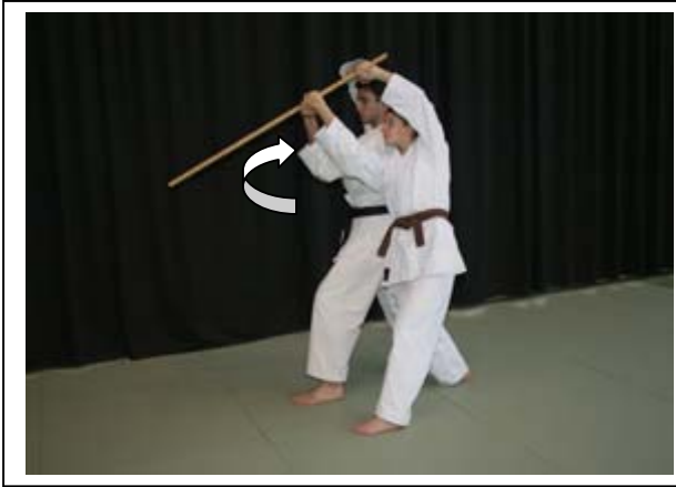
...Rotation à 180° par la D... 4