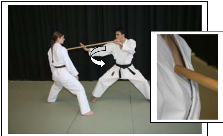
Atémi de la pointe du bâton au plexus... 5