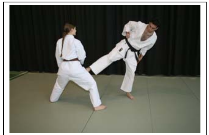
ATEMI CIRCULAIRE DU PIED niveau... 8