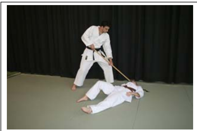
Désarmer et retour en garde 9