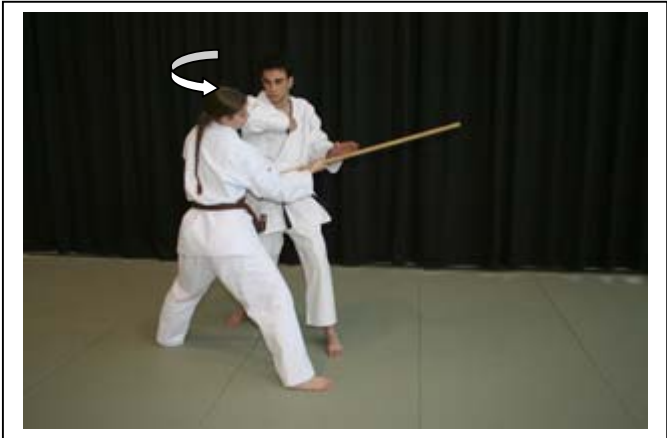
ESQ AV INT à 45°, atémi circulaire du coude D 1