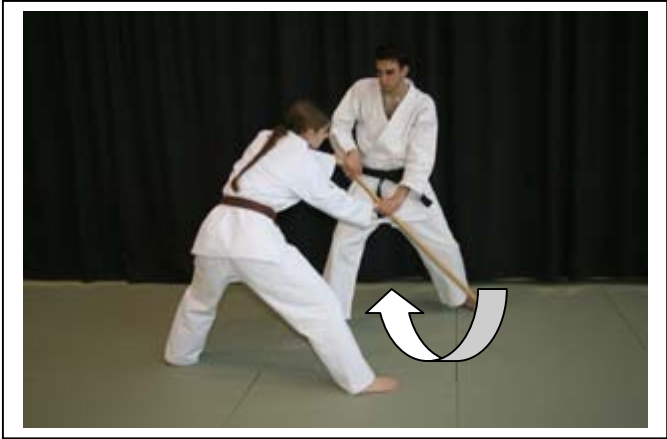
...passer la pointe du bâton devant UKE... 3