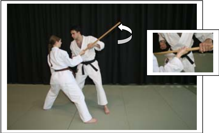
...par atémi du coude D, passer le coude G devant UKE 3