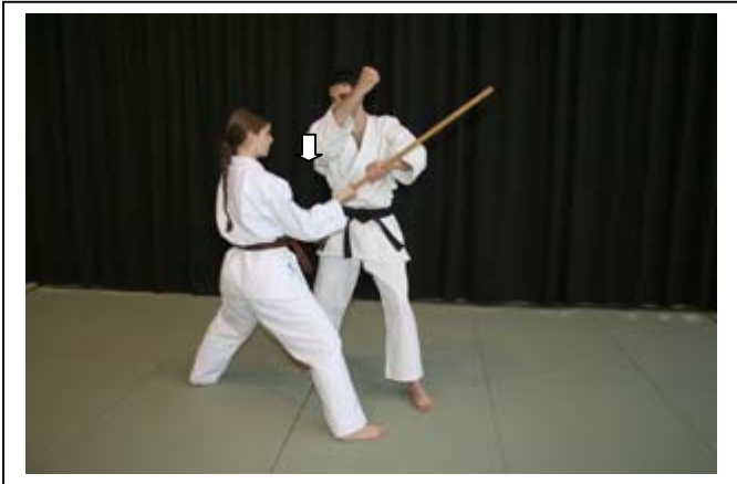
Dégagement de la main G... 2