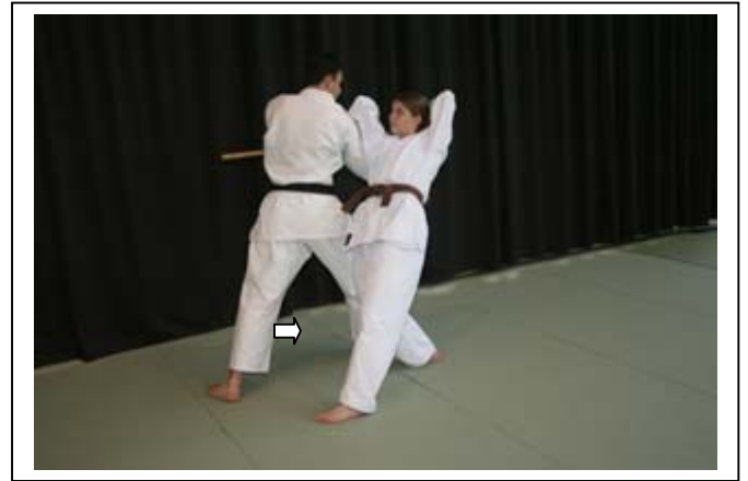
...Déséquilibre ARR et ... 6