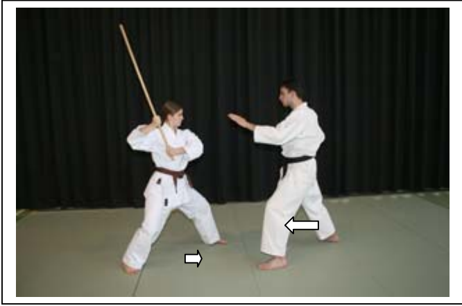
BATON : ATTAQUE HAUTE DE BIAIS