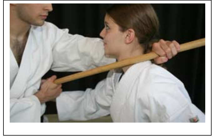
...de la main G, CLE DE COU par pression du bâton sur 6 la carotide